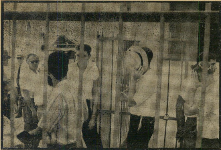
תוקפי המיסיון מובאים למעצר (1963) במקום חוליגאנים ברחוב -

אנשי גח"ל באים אלינו ואומרים: אנחנו לאומניים ציוניים ואתם לאומניים ערבים - לכן רק אנחנו יכולים להבין אתכם ולתת לכם להקים מפלגה לאומנית. אלא-הוא היא בת הכרית הטבעית שלנו. יתאר ערבי אחר את דברי גח"ל תוך כדי לילגל. "אבל הבחורים שלנו בכפר קאסם זרקו אבנים