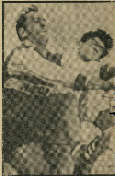
כספי בולם את קונסטמליך * כשמוטלה משחק טוב

כמו בכל שבת, נעל מוטלה שפיגלר את נעל ימין לפני נעל שמאל, הקפיד לעלות על המגרש ברגל ימין לפני רגל שמאל. הוא הסתכל סביבו, ועשרות ה נתניית'ים, שבאו במיוחד למלכס, הריעו לו. אחרי תשעים דקות מישחק ידעו