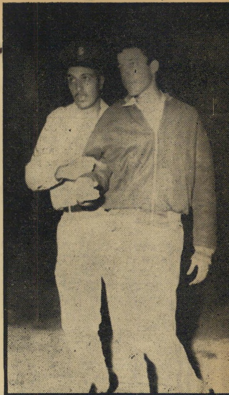
העצור צעיר משכונת התקווה מובל על-ידי אחד השוטרים למכונת העצורים, בערב השבת האחרונה.

במרבית המקרים מצליחים גונבי המכוניות להימלט מהשוטרים יחד עם ריכבם. לא קרה עיד מיקרה שהמשטרה הצליחה לתפוס את הגנבים עצמם.