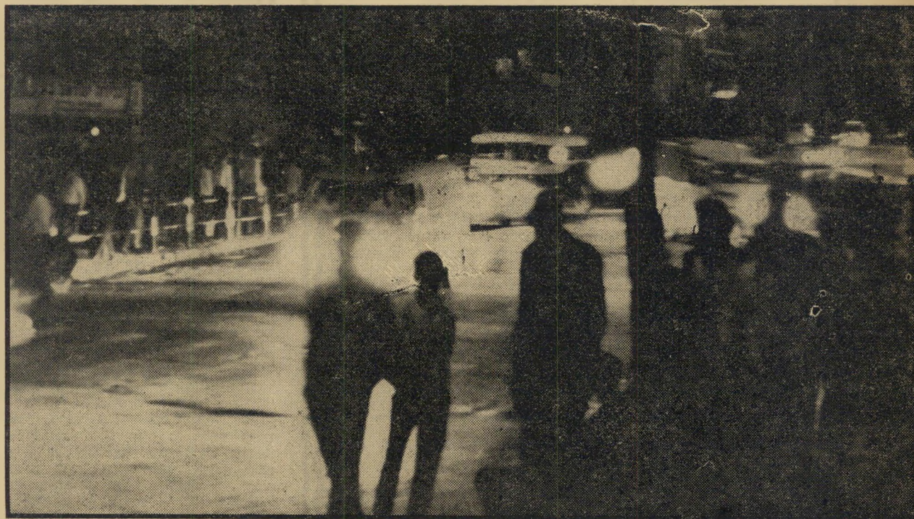
מכוניות החרקה הופיעו במקום ניידות-המשטרה. יחד-איתן, בי-חשכת הלילה, פעלו אנשי-האגרוף שסייעו למשטרה. הופעת השוטרים חישמלה את הצופים, שהפכו באותו רגע מסקרנים למפגינים.

"החלטנו שהכי טוב יהיה אם נעשה חרקה במכוניות גנובות, ודחאק לעיני הי-משטרה. אנחנו משכונת שאבזי התחלנו