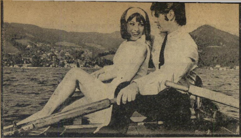
העופרים בשווייץ הלך זוריר אצל עורב

פרטי החווה, לפיו זרקה הממשלה הון רב כדי לממן מלון השייך לפקיד בכיר לשיעבר במשרד המסחר והתעשייה.