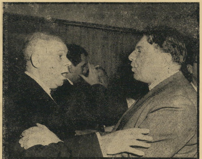
קולק (וא'ש=שלום): שנוור נשאר שנוור

אף תיכוננו של המוויזאון אינו מניח את הדעת. האור אינו מחסת כפי שצריך, אור השמש ואור החשמל מתחרים זה בזה. באולמות המיועדים לתצוגת תמונות - במקום שהתאורה היתה חייבת להיות מ- מדרגה ראשונה - הם מטטלים זה את זה. לוחיות הנחושט או הבדיל הקביעים ב- ריצפה גורמות להבהקים. העמודים הענקיים שוללים מן הקירות, שעליהם תלויים ה- מוצגים, את ניטראליותם. המיבנה נעמיס