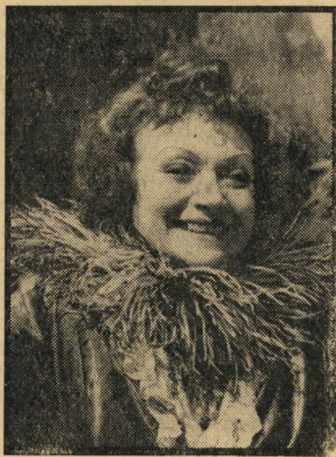
שחקנית-מישנה השנה לילה קורדובה זורבה היווני

שני סרטי-אחירה יומרגיים זכו השנה להצלחה מיוחדת: זורבה היווני ואמי ריקה אמריקה . שניהם דומים לסרטים טובים, אך חסרים את העומק שלהם, ועליכך קלים לעיכול. יש בהם הווי אקזוטי וריי קורים יווניים, האהובים על הישראלים עוד מאז אליקי. יש בהם שילוב נכון של כל הסמנים האהובים על הקהל, כפי שנקבעו במחקרים אמריקאיים מקיפים של טעם ההמונים. יש בהם קצת הווי, קצת אקזוטיקה, קצת אווירה, קצת שירים, קצת ריקודים, קצת אהבה, וקצת אמת. האפוסיה הנפלאה של שבט השייאן, העובר מרחק של אלפי קילומטרים כדי להגיע לביתו, הועלתה בארץ השנה עליידי ג'ון פורד ( הקרב הגדול ) ויורה לאחר זמן מועט מהבד. סיפורו היפה של ילד הרודף אחרי השמש ( בעקבות החמה ), החזיק כאן מעמד שבוע ימים, וסרטים אחרים, ברמה דומה, לא הגיעו הנה בכלל. לתגובות חריפות מאוד זכה השנה סרטו של ג'רי לואיס, התלמים , אבל כיוון של אותן התגובות זכו סרטיו של צ'רלי צ'פלין במשך עשרים שנות נעוריו, לא כדאי לחזור עליהן. אפשר לקרוא אותן בכל (המשך בעמוד 26)