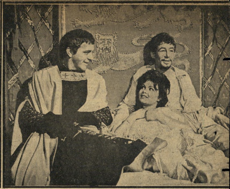
3. בקט (ארצות-הברית)