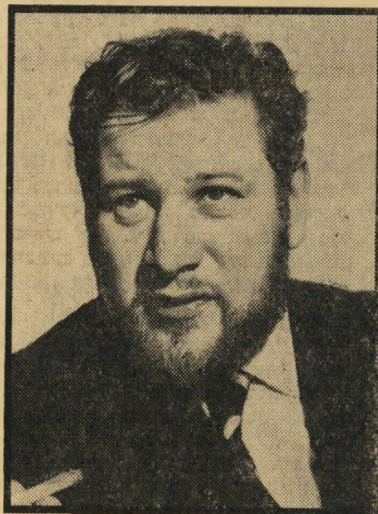
שחקן-מישנה השנה פיטר יוסטינוב טופקאפי

בסרט שבוסס על מחזהו של ג'אן אי. שתיאר בכוח מיוחד את דמותו לכותית, המפונקת, של המלך האנגלי השני, והאהבה המזוהה שרכש לידו. גרט טוב נוסף הגיע בסדרת סרטי סת, זה היה סרטו של פיטרו גרמי, תזוי נוסח איטליה , סאטירה מרתקת אנטי-הכפר בסיציליה, על מושגי הכבוד, והמוסר שלהם. מן הקולנוע גוף לזוי הביא השנה ראל שני סרטים מעולים על שני נושאים שונים. הראשון, המשרת , תיאר רח שטנית את השתלטות כוחות ה' על כוחות האור, והשני העלה זה פציפיסטית בתיאור קודר של חייל מפשע שהוצא להורג במלחמת העולם השונה — ( למען ידעו ). מן-קולנוע אחר, ויליאם ויילר, תיאר רח עדינה ומותחת יחסים רבי-רובים, קמים בין מופרע חסר-תרבות ובין ה משכילה מלאת-חיים ( האספן ). מופ' מ, חסר-תרבות, וסוטים הועלו גם לילה של האגואנה , בלדית, וד הרבה סרטים סוג ג' רד.