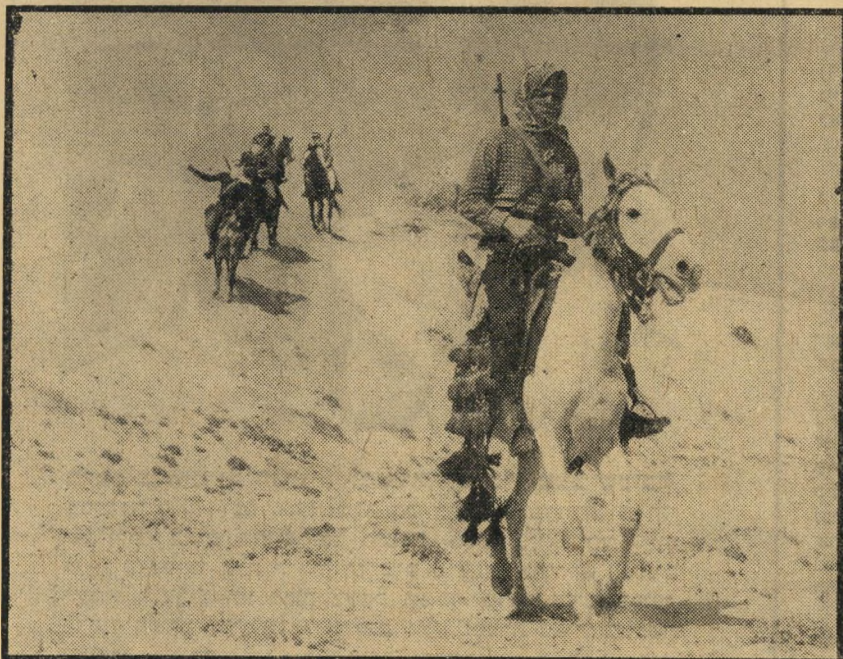
4. מורדי האור (ישראל-ארצות-הברית)