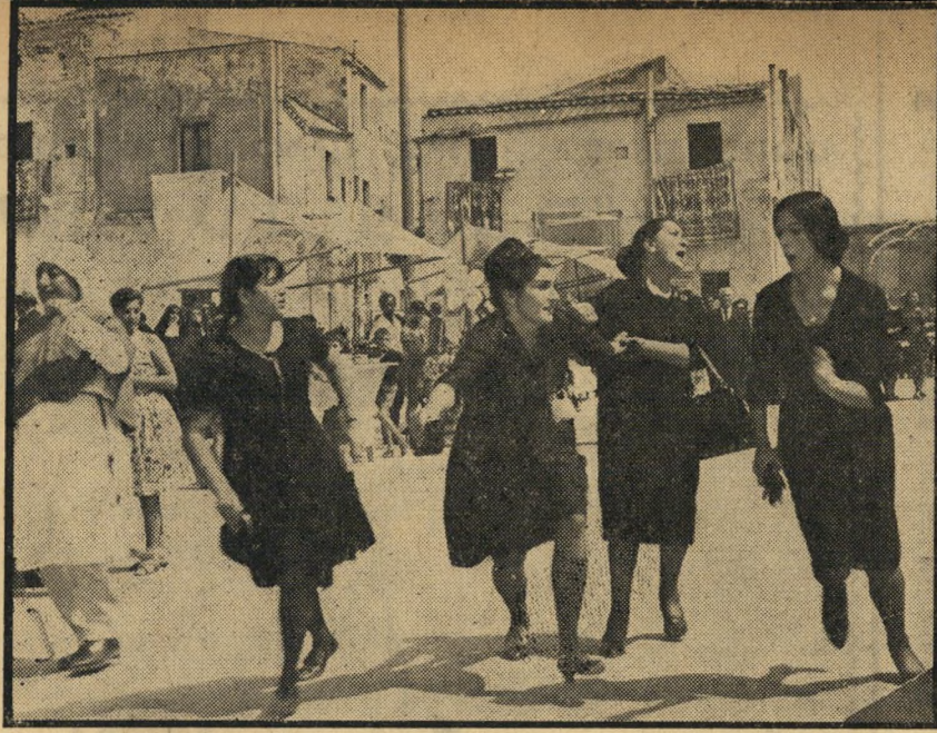
4. פיתוי נוסח איטליה (איטליה)