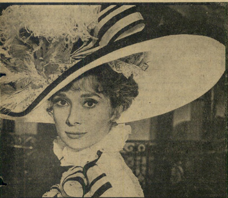
2. גבירתי הנאווה (ארצות-הברית)