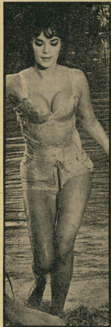
נטאלי ווד אין מה להסתיר

סרטו האחרון של ז'אק-לוק גודארד פיירו המשוגע זכה לביקורות קשות מצד מבקרי-הקולנוע של פסטיבל ונציה, אבל לעומת זאת זכו הביקורות של מבקרי פסטיבל-ונציה לביקורות חריפות מצד ז'אק-לוק גודארד: "יש לכם הזכות לאהוב את הסרט או לשנוא אותו", הוא אמר להם, "אבל אין לכם הזכות לא להבין אותו." ● לבריג'יט בארדו נמאס כבר להיות חתולת-מין. היא החליטה שבגיל שלושים הגיע הזמן להפסיק עם זה. בסרט הבא שלה, שיוסרט בטוקיו לפי סיפור של ג'אן אנואי בשם החתולה הגינינית, היא תהיה חתולה אמיתית. הצרה היא של קארין החליטה גם היא להיות חתולה אמיתית, ודווקא באותו הסרט. מפיקי-הסרט