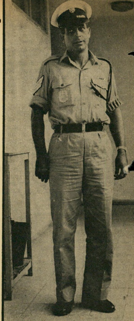
הגיבור סמל הנפה הצפונית שלוש אפרתי, שגילה קוריוז ומסירות למופת, בדלקו אחרי העבריין ה"מועד שנאבק עימו וניסה לחנוק אותו.

קול נפץ של שימשה ורחש שעלה ממש"רדי חברת תרמואיל בדרך חיפה, היפנו את תשומת-לבו של שכן חשדן שאיחר ללכת לישון. הוא מיהר להזעיק את המשטרה. ניידת-הסיור שנשלחה מהמוקד מיהרה ל"מקום, אבל הפורצים הרגישו כנראה בתכו"נה נה סביבם, ניסו להימלט ברגע האחרון. הם ניפצו את אחת השימשות, התגנבו ה"ר