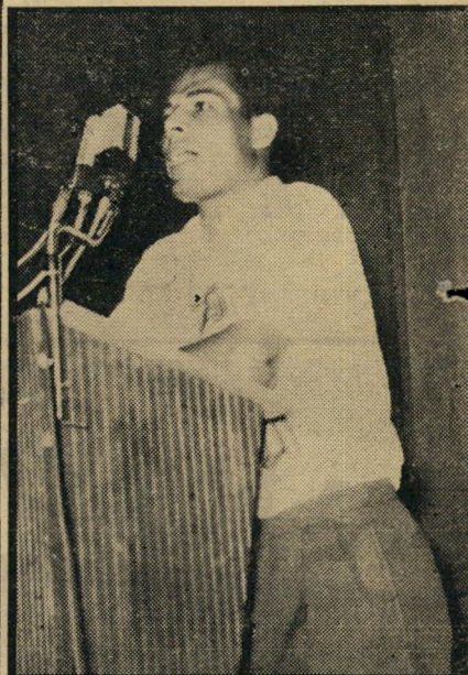
מהמשולש הביע אהמד מצאר־הה אמונתו, כי ה־דרך לשלום היא שיתוף הפעולה העבריירעבי, כפי שהתגלם במאבקיו של העולם הזה.