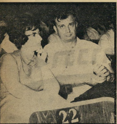
חושבים הם לא באו בתשובה לקריאה סתמית. הם יודים עיס מה נעשה במדינה — והם חשבו והחליטו.