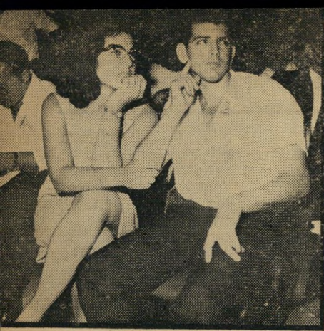
ביחד תופעה אופיינית של העצרת: באו זוגות רבים, ברובם נשוי־איים, שהחליטו לאחר דיון, כי מקומם שם.