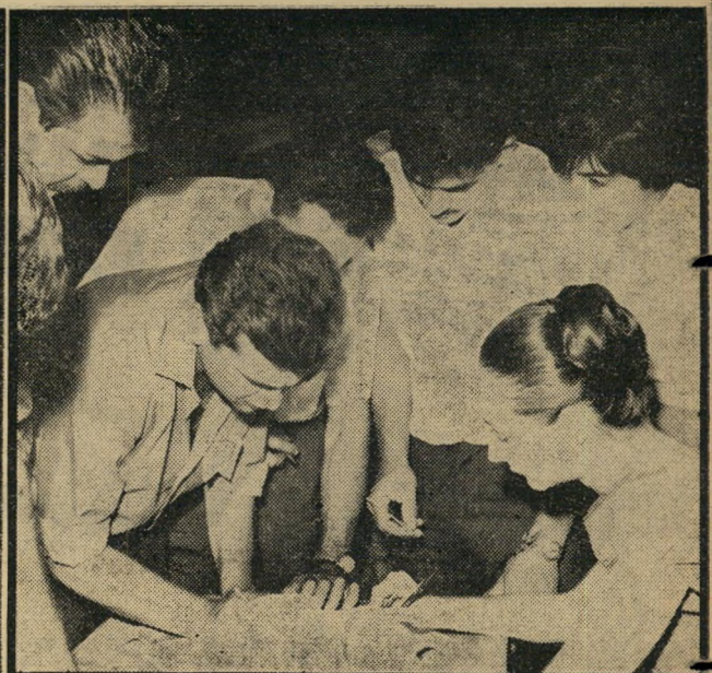
מיבצע ההחתמה סיים את העצרת. לפי תקנות הבחירות, דרושות חתימות־הם של 750 בעלי זכות־בחירה, כדי שרשימה חדשה תוכל להשתתף