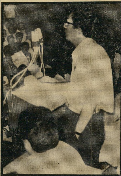
מהאוניברסיטה נשמע קו־ריאל מירון. הצעתו: הקמת ממשלת־צללים, כדוגמת זו שבראש האופוזיציה בבריטניה.