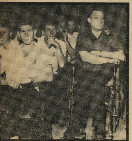
שני דורות של לוחמים. הוא שיני לם סחיר יקר, וי מוכן ללחום שוב, שהקורבן לא יהיה לשוא.