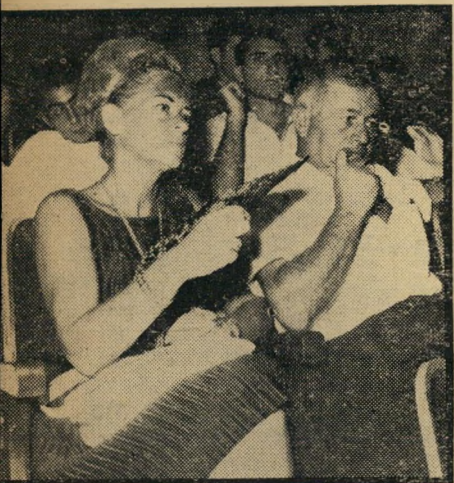
השיבה זרקה בשערס, אך הראש בוחן רעיונות צעירים. הבעת פניהם אומרת: זה לא מישחק ילדים.