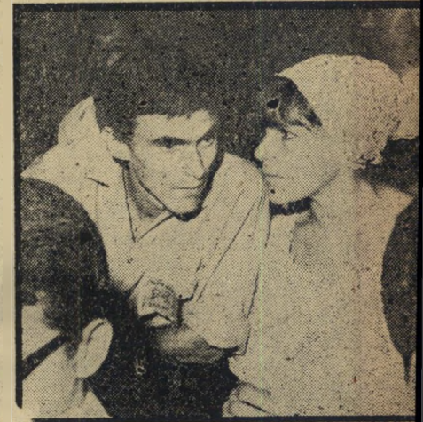
המלך שחקן הקאמרי אילי גורליצ'קי, כוכב שלמה המלך וי שלמי הסנדלר, מחליף דעות עם אשתו.