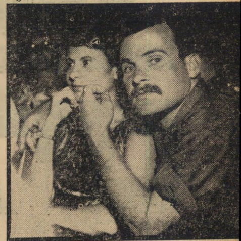
המחר אילו נתבקש מישהו למצוא בשנת 1965 זוג שיענה על ההגדרה "פּלמחניק מחפש את המחר" — זהו.