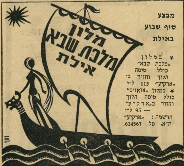
טוס "ארקיע" ל"מלכת שבא"