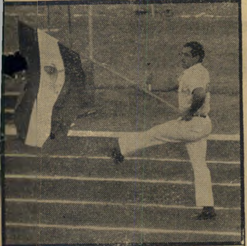
נושאי-הדגל הפרטי ברוז