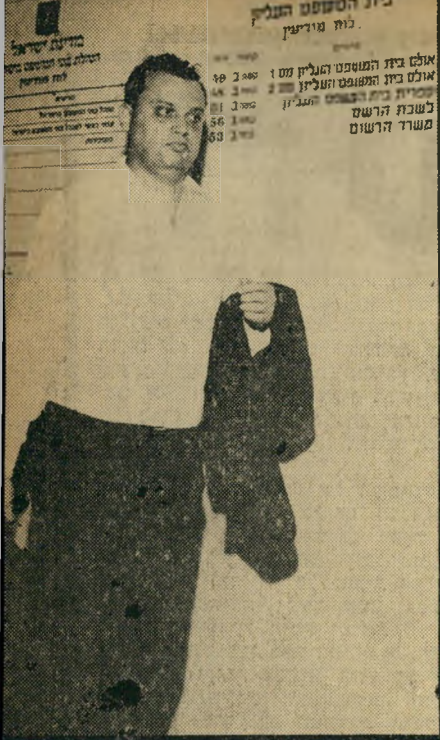
עזרי זכרוננו מגיש את הבג"צ קנוניה של אגודת מפלגות

השבוע מעודדים למדי, כי אין חור במדינת ישראל, בו אין תומך נלהב של העולם הזה, המוכן להתייצב למלחמה הגורלית על דמור תה הדמוקרטית של המדינה. יום אחרי שהוקם הסניף בחיפה, נחנך הסניף באור-יהודה. זוהי עובדה בעלת מש" מעות מיוחדת. כי אור-יהודה, שהוקמה על הריסותיה של מערכת סקיייה, היא דוגמה קלאסית של השמורות, אליהן הכניס המיש" טר הקיים את מיליון בני "ישראל השנייה". המפלגות הגדולות - ובראשן מפא"י וה" דתיים - תילקו ביניהן את בני העלייה החדשה, כאשר אלה לא ידעו עדיין לתוך איזה מציאות הם נקלעים. לאחר ששמורת-טבע מסוג זה נרכשה על-ידי מפלגה מסויימת, היא הפעילה את כל מכשירי הכוח, השותף וההפחדה שלה, כדי לוודא שתושבי השמורה הוּו לא יברחו החוצה ולא יצביעו בבחירות למען מפלגה אחרת. השבוע נשברה אחיות-החנק על אור-יהודה. נגד הבוסים האלימים, שהוש" לטו על-ידי מפא"י וחברותיה, קם כוח עצמאי מבני-המקום, שהצהיר: "אנחנו שיי" כים ליתר חלקי הארץ. הזעזוע שגרם חוק לשון הרע לא פסח עלינו. אנו מתייצבים לצד העולם הזה."