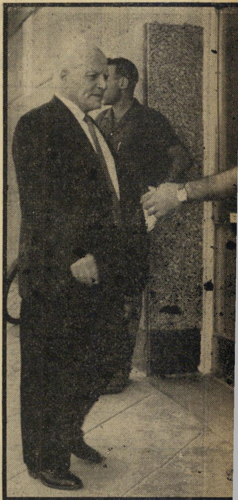
היד מושמת ליטורית בן-גוריון לא רצה

תתופעה הקרויה את"א (אזרחים תומכי אשכול) הוסיפה לשעשע השבוע את רחוב דיזנגוף, לשמש לו תומר לא-אכזב לבדי-חות. דני זיידל טען כי אתא אינה החנות היחידה לבגדים המצטרפת למפלגה. גם החנות אביג (אוהדי בן-גוריון) מצטרפת למאבק, וכבר השיגה כמה פרופוסורים ו"דרנים. ואילו החנות מצ"ן אמנם לא הגזירה את עצמה עדיין מבחינה מפלגתית, לדבריו, אבל היא מחפשת את נחמן פרקש, כדי להתחיימו על תמיכה למישהה. על הזמר ישראל יצחקי סופר כי הגיע לארץ במסו, ושלוש משלחות — של המערך, רפ"י וגח"ל — המתניו לו בשדה-התעופה כדי להתחיימו. תוך כדי כך נודעו כמה פרטים על מיפעל ההחתמה. בשעה שאורי זוהר בא לקאמרי, נתקל