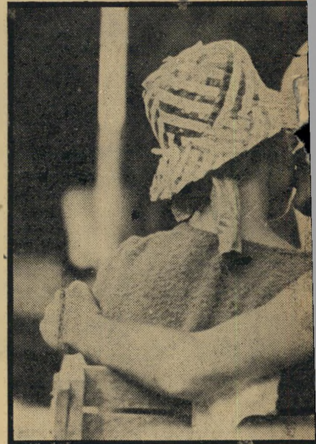
ביבי, המעיד על עצמו כי הוא יוצא מזה שבוע וחצי וא הסביר כי מלון רמת־אביב בצפון תל־אביב שמשש בית המלון לבלות סופשבוע, כדי לצוד שם תיירות.

היא חשבה שאולי הראשון היה סתם לא מנומס, אז יצאה עם אחר. הם הלכו לבית־קפה. מה עשה הגולמז במקום לחכות שהיא תשב ראשונה, התיישב לו בנחת ואמר: „נו, תשבי כבר“ לא נעים לה, אבל היא מוכרחה לומר שהיא מאוכזבת נורא מהגבר הישראלי. היא בשום אופן לא היתה מחליפה אותו בצרפתי כן, היא שכחה להוסיף עוד הש מזה. הם סגובים נורא. היה אחד שחזר אחריה רק אחרי שהיא אמרה שהיא גרה בשרתון. היה נדמה לה שהוא מחזר אחרי המלון ולא אחריה.