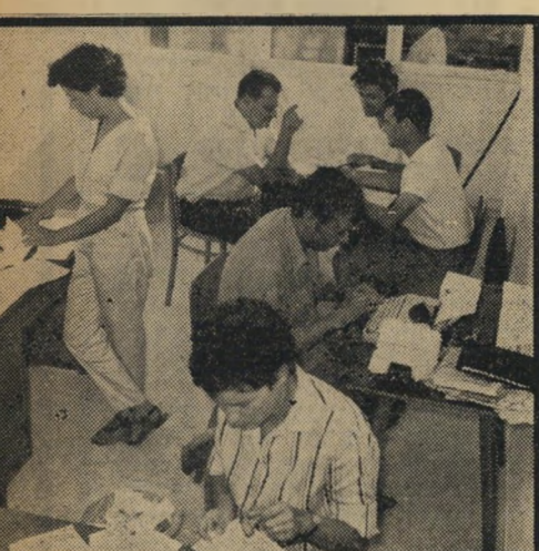
אירגון מטה הבחירות בתל-אביב