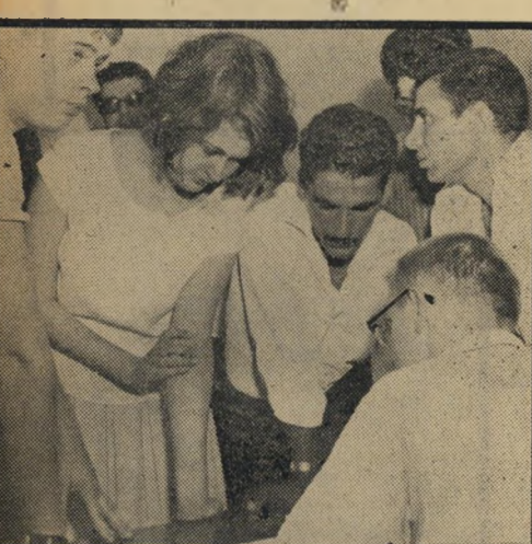
רישום המתנדבים שהציעו עצמם