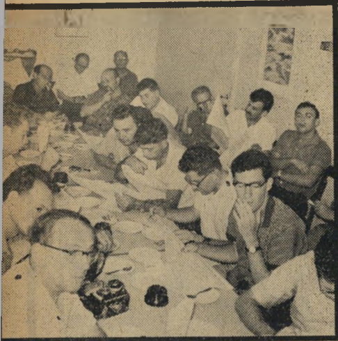
מסיבת העתונאים: קריאה המצע

● כתובת המשרד: תל-אביב, רחוב קרליבך 14, טלפונים 30134, 30135. אוהדים המוכנים לנדב למשרד צורכי משרד כלשהם — החל בשולחנות וכלה במאוררים, מתבקשים לעשות זאת. ● הכתובת בחיפה: רחוב הרצל 61, טלפון 66734. ● הכתובת בירושלים: יהודה בן-משה, רחוב שמואל הנגיד 21, קומה ב', טלפון 39988.