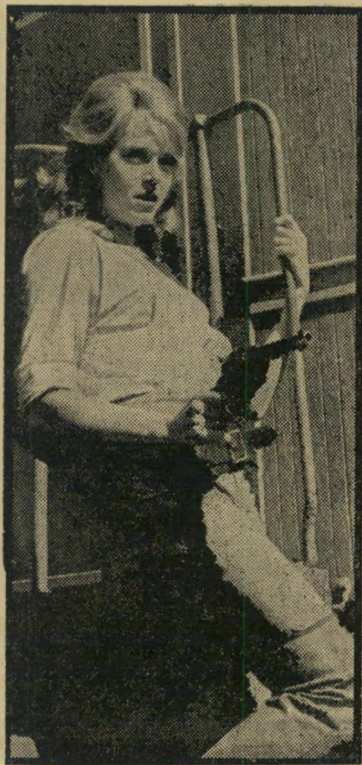
שחקנית פנדה — לפורים