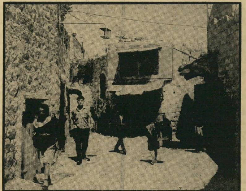
כאן גרו יהודים לפני המלחמה. הבתים ה' שייכים להם. רבים מן הדיירים החדשים הם לומדות תלמידות סוכנות-הסעד של האו"ם. פליטים מישראל. בבית-היתומים היהודי הסמוך