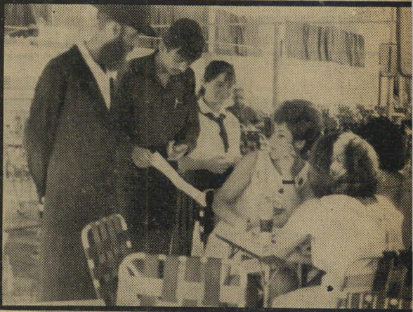
בבית הקפה „מה פתאום?” משיבה הצעירה בקפה רחל להצעת החתימה. בי-תחנת הרכבת הצפונית (למטה) היו תגובות הקהל דומות.