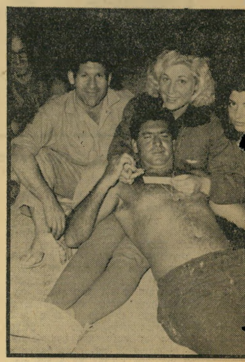
- בפעולה -

המורה החורג וקרא למנהל. המנהל הח-ויר כששמע את האשה, שחזרה על הסי-פור לכבודו: "זאת גימנסיה? זה בית מלוכי לך! ככה אתם מחנכים את התלמידים של-כם, לחיי-זנות?! כחרכו, אני עוד אבוא לכאן כל יום לעשות סקאנדלים, עד שתסלקו מהעיר הזאת את המורה הזאת." עם הסיכות על הראש והחלוק הפרום היא רצה ישר למחלקת-החינוך של העיר-רייה ולראש-העיר, ואמרה להם אותם הד-ברים. משם היא רצה לנמל, לספר למנהל מי הוא בעלה.