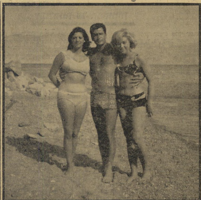
- בפעולה -