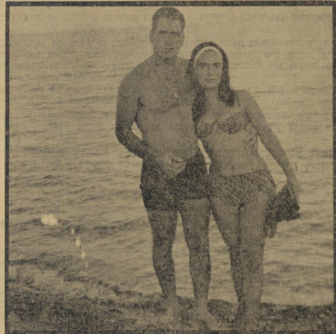
"מיסר פיפטון" בפעולה -