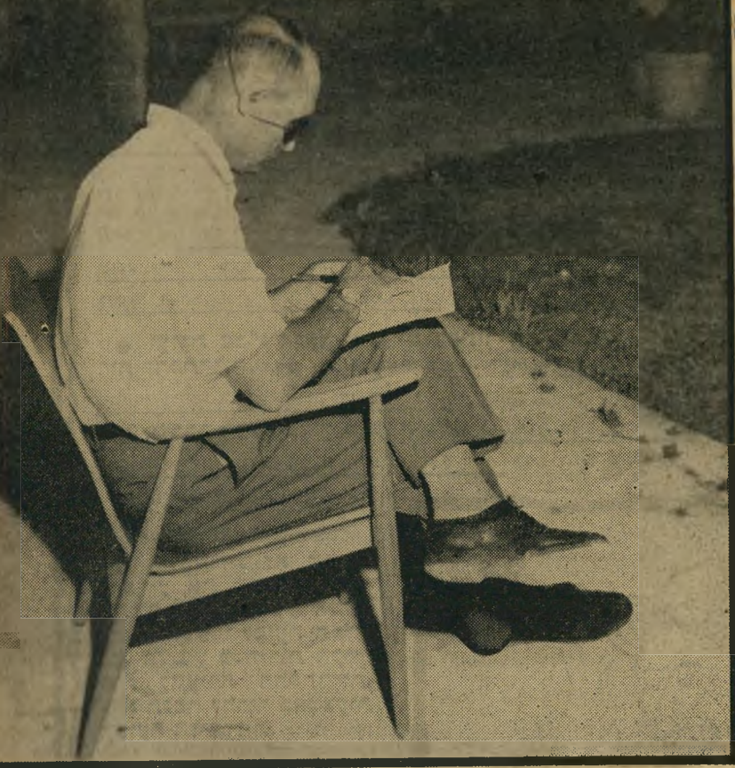
דיין לבד, לגמרי לבד