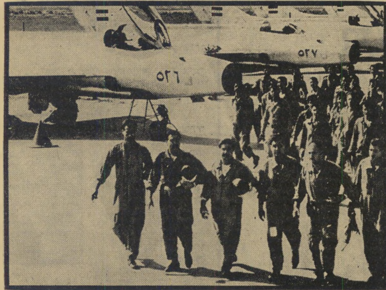
טייסים סוריים וזהק "מיג 21" במקום טייסים — קללות באוויר

רקה שותקו. שר הפנים הסודאני הורה ל"החרים מיצבור נשק שהוחזר למדינה" בצור-רה המעידה כי נועד להפלת הממשלה.