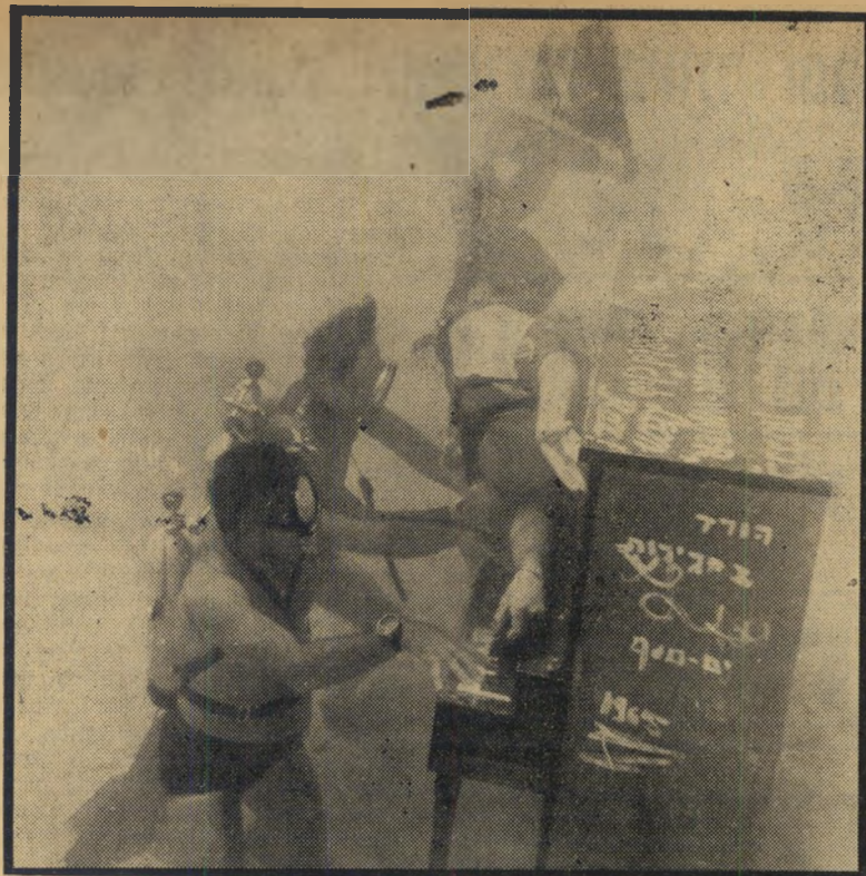
הפסנתר והמנגנים מתחת לפני המים באילת צילום ממעמקים

העולם הזה שבועון החדשות הישראלי המערכת והמינהל: תל-אביב, גליק סון 8, טלפון 226785, ת.ד. 136 מען מברקי: עולמפרס • דפוס משה שהם בע"מ, תל-אביב, פין 6, טלפון 31139 • העורך הראשי: אורי אבנרי • המו"ל: העולם הזה בע"מ.