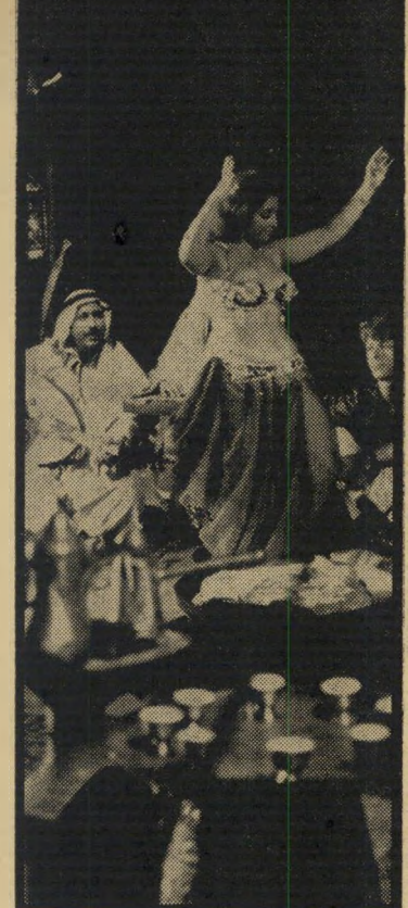
רקדנית הבטן הקורקבן זע -