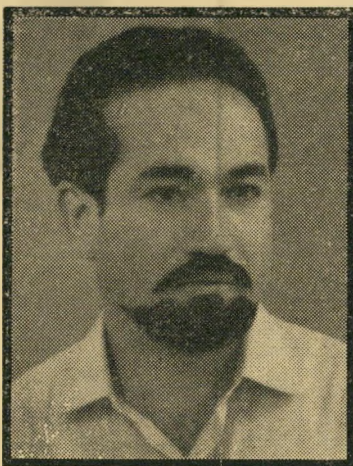
אלדר "ניבזה יקר..."

הצעה אחרת, סוציאליסטית יותר, היא בעלת סיכויי התממשות. היא קובעת: ועדה מיוחדת תחלק מקומות קבועים לחברים. היא תתחשב בכל מכלול הגורמים — כמו ותק, גיל, כושר ראייה ושמיעה, קירבה משפחתית, קשרים חברתיים, אורך הגוף העליון, גובה התסרוקת, התנהגות ספונטאנית בשעת ההקרנה, וכושר תפיסה. "דירוג זה מסובך למדי", קובעת ההצעה,