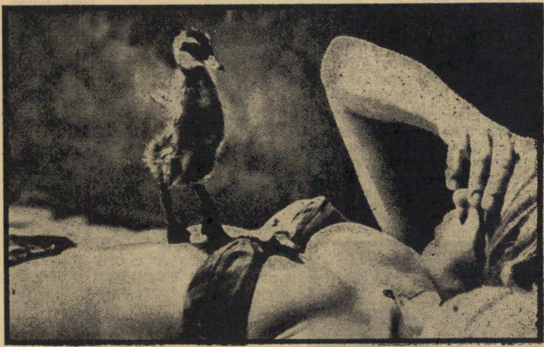
בריג'יט בארדו והברווזון בזירות מהירה