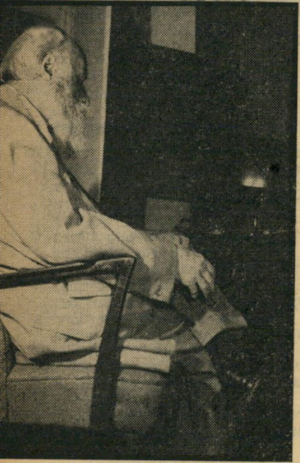
מארטין בובר כל הכבוד

"כל המעצמות הגדולות היו תומכות בבורגינה, לולא פרץ הסיכסוך בליגיה." ארצות-הברית פירסמה הודעה חיובית עוד לפני שהתפוצצו העניינים בקאהיר. גם האחרות היו עושות זאת, לולא חששו לפגוע במדינות ערביות אחרות.