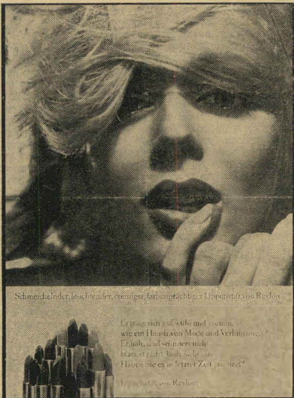
Schmeichelfeder, Leuchtemer, zweniger, brennprächtiger Lippenstift von Revlon