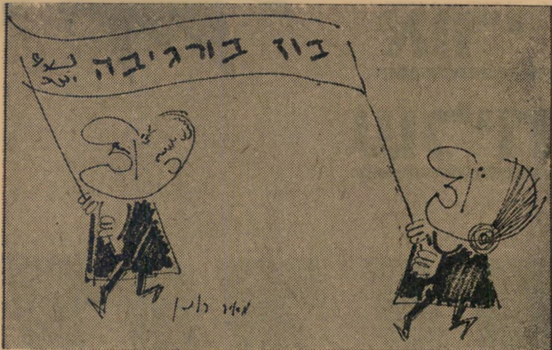
שותפות גולדה'נאצר ב"ציפורי הנפש"

קאריירה של סופר. אחר חתם "זאטופק", היה אחר רחמן בבית-חולים.