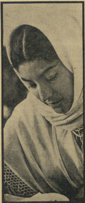
סטודנטיות רוטות ב"אל-אזהר" השפה, לא הדת

הממשלה שהפילה את הדיקטטורה הצי-באית של הגנרל איכרים עבוד, לפני ששה חודשים (העולם הזה 1417), נידונה מראש לכשלון. היא היתה מורכבת מאלמנטים כליכך שונים, שאחרי ההתלהבות הראשונה של ביצוע ההפיכה המוצלחת החלו מתבלטים בקרבה הניגודים בין הקומוניסטים לבין הקנאים הדתיים, ובין אלה לבין