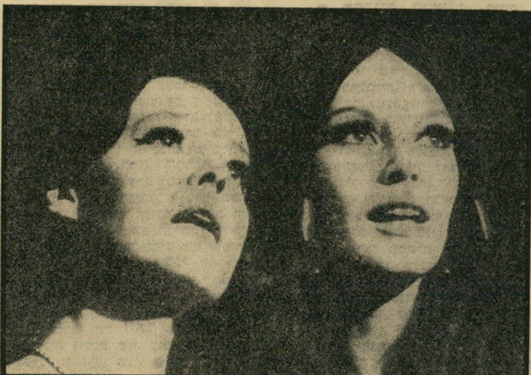
בררו ומורו ב'יוה מאריה' פעמיים מספיק

לנספת-הענתונות בשגרירות הישראלית אין תקציב לזה, אבל יתכן שבמועדון-לילה קטן בקאן תופיע בחקופת הפסטיבל אינו זמרת ישראלית, אולי יפה ירקוני. אם זה