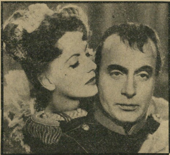
גרבו ושארל בויה ב"מאריה ואלבסקה" „האם את מאושרת? — אין תשובה

שניהלה עם השחקן ג'ון גילבר, ממלא-מקומו של רודולף ואלנ" טינג, עם ליאופולד סטוקובסקי המנצח ועם גיילור האוסר. יתכן שהיא הסתגרה בארמון-השן שלה כדי לא לפגוע בדמות המסתורית שגילמה על הבמה. אבל מלבד זאת, ברור היה שהיא פחדה, משום שבעצם היא לא היתה גרבו. היא היתה גרטה שבדית בשם גרטה גוסטבסון, שעבדה כמזכרת-כובעים קטנה בתנות כליבו בשטוקהולם. היה דרוש לה הרבה כוח, הרבה אומץ וחומות גבוהות, כדי לעמוד בפני האלוהות שהוענקה לה. בשנת 1941, לאחר עשר שנות מישחק, היא עזבה לפתע את הבד, השאירה למעריציה את עשרות הסרטים שעשתה, ונעלמה מאחורי זוג משקפיים גדולים כהים באחת הדירות האנונימיות של ניר-יורק. מה היא עושה שם? היא מתבודדת. לאנשי המעלית בביתה יש הוראות המורות לא לתת לאיש, מלבד העוזרת, לעלות אליה. היא קמה יום-יום בשעה שבע בבוקר, מכינה לעצמה ארוחת-בוקר, אוכלת אותה במטבח. כשהעוזרת באה, בשעה תשע, היא יוצאת מהבית. משעה תשע וחצי עד שתיים-עשרה וחצי היא עורכת את טיוליה הנצחיים בחובות הפחות-מרכזיים של ניר-יורק. היא עושה זאת כל יום, בכל מזג-אוויר, כשלאשה מגבעת קטנה. לעיניה משקפיים כהים, ולגופה זוג מכנסים