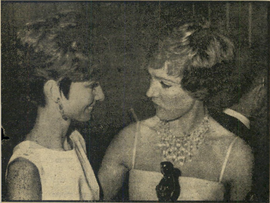
אנדריוס (ימין) מקבלת את האוסקאר מידי הפבורן פרטיטוטציה

הלב האמריקאי המרחם על ליו טיילור צריך גם להתפרנס, לקבל תפקידים בסרטים, להתקדם בקאריירה, ובחירתו האוסקאר יכיר לה לעזור לו בכך. לפרס האוסקאר יהיה ערך כשלא יהיו לו כל-כך הרבה שופטים, כשייצרו סרטים אמריקאים טובים יותר, כשטעמם של האנשים ישתנה, וכשהקהל האמריקאי הממוצע יספיק להיות קהל אמריקאי ממוצע.