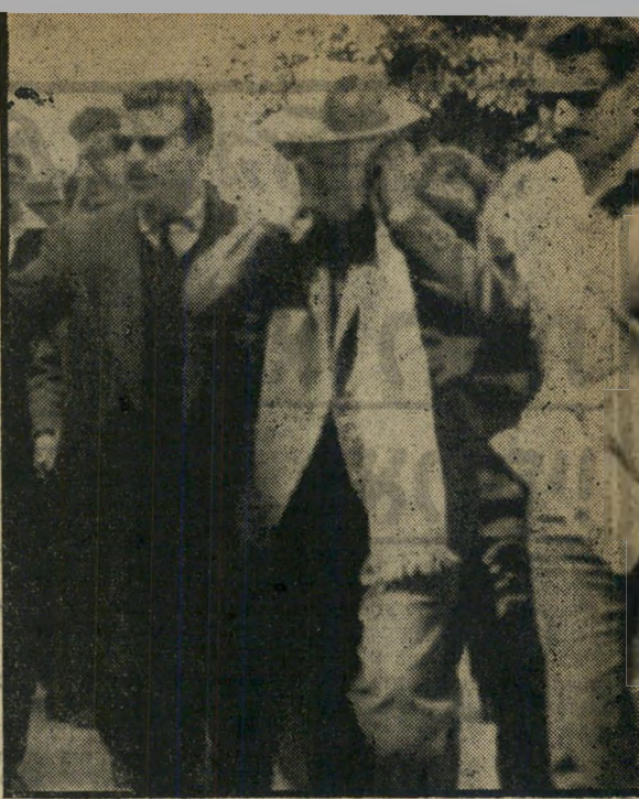
חשוד עמנואלי (מסתיר פניו) בין כלשים תכשיטים באבטיח

שוילי הוליך את השוטרים לאותה מסעדה, קרץ בעיניו, בעזרו עומד בפתח, לבעל המקום. הלה הבין מיד במה המדובר.