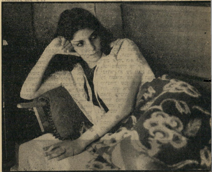
נאשמת מזרחי נמסר ליו"

ק בע השופט יורן, בפסק-דין אליו הצטרף גם השופט חיים בנטל: שופט השלום המלומד קבע בבירור, כי המשיבה, בעומדה ברחוב, פנתה אל היתלונן במילים, עשר לירות, והוא הבין את כוונתה, נתן את הכסף והלך איתה. או למ השופט המלומד סבר, כי לא היה בכך משום, שידול, כיוון שהמילה, שדל, או solicit באנגלית, פירושה הצק בבקשות, הפצר בעקשנות או הטרד (importune), ואילו המשיבה לא הפצירה במתלונן, לא הציקה לו בדיבורה, ולא הטרידה אותו. אכן, יש לציין, ראשית, כי הפירוש הנ"ל אינו הפירוש היחיד או הבלעדי של המילה solicit, והוא מתברר עוד יותר עלידי ה- הבול הקיים בין החוק באנגליה ובסקוטלנד בנידון זה. וכך, בסעיף (1)167 שלנו, נאמר כי שידול יכול להיות by word or gesture.