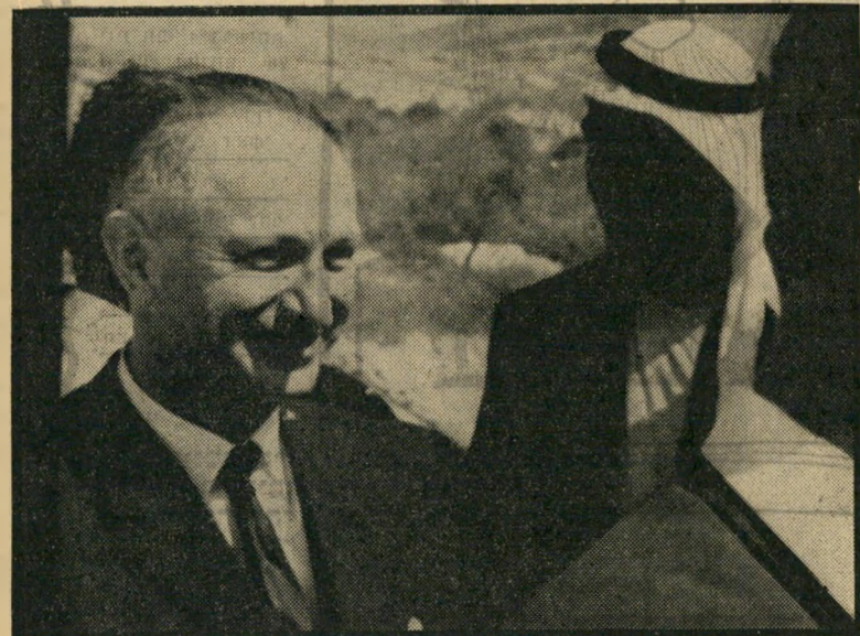
יועץ עמיר בפעולה, המושל הצבאי הראשון ליהודה

האם יעשו זאת המעצמות הגדולות האם עשויה מלחמה בשנת 1965 לשאת פרי כלשהו לישראל? על כך במאמר הבא בסידרה זו.