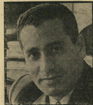
עוזר הייכל הטיפה המרה או השאיפה המתוקה?

הפגישה הראשונה בין גמאל עבדאלנאצר והייכל היתה מיקרית. מספר חודשים לפני הפיכת ה-23 ביולי 1952 ביקר הסגן-אלוף הגבוה אצל גנרל מוחמד נגיב, כדי לדבר איתו על תוכנית ההפיכה. נגיב הציג בפני אורחו צעיר בעל קומה בינונית. היה זה הייכל. עבדאלנאצר דחה את שיחתו עם נגיב, חיכה שהייכל יסתלק. אך זה נשאר יושב במקומו, פתח בשיחה על כניעת המלך