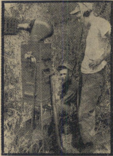
נחתים ומכשירי ראדאר אש על רוחות רפאים

אין ספק, כי במקומות אלה מפציץ חיל- האוויר האמריקאי כפרים אזרחיים, המשמ- שים — לדעתו — בסיסים אזרחיים או צב- איים לויאט-קונג. היסול כפרים בפצצות נאפאלם מתקרב, למעשה, לשיטות ג'ונסידה. נשק הפרור. לא פחות חמורות ההתק- פות על הצפון. בהתקופו "דרכי תחבורה", "בסיסי חיל-הים הצפוני" וריכוזים "קומו- ניסטיים". מפציץ חיל-האוויר, בלי ספק, רי- כוזים ניכרים של האוכלוסייה האזרחית, כמו בכל מלחמה אזרחית. השימוש בנאפאלם ל- מטרה זו מגביר את הוועה. המטרה האמי-