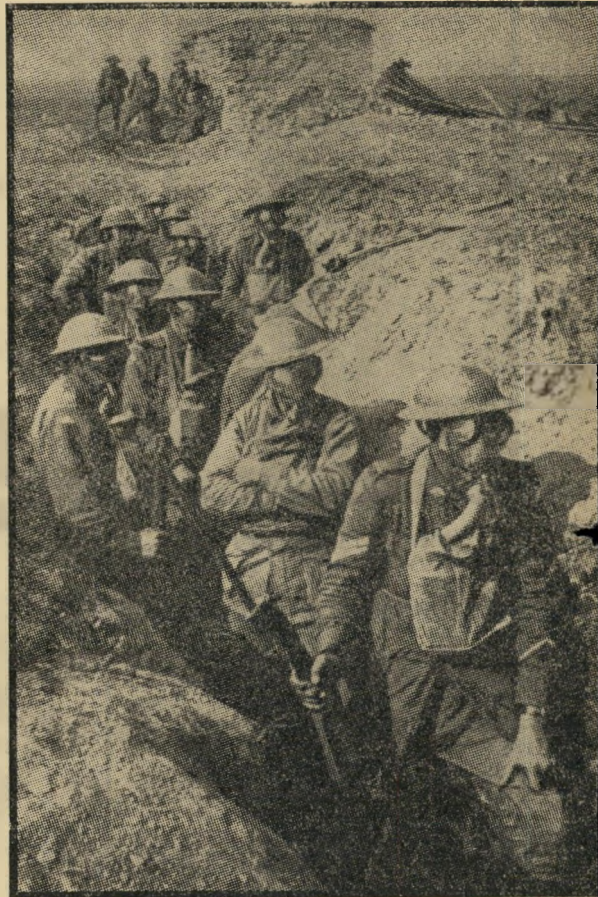
חיילים מוכנים להתקפת גאזים (1915) אפיזו היסלר לא רצה

הודעה זו עוררה בבריטניה תרעומת לא פחותה מזו שנתעוררה בעיקבות השימוש בגאזים. כי מבחינה מעשית, זהו נשק זועתי יותר. הנאפאלם הנוער, הנידבק לגופו של אדם, אינו ניתן לכיבוי בשום דרך שזיאה. זולת הטבילה בשמן - דבר שאינו אפשרי ברוב המיקרים. סיפורי זוועה. למה מתכוון חיל-האוויר, בדברו על "ריכוזי ויאטקונג"? צבא הוויאטקונג (קיצור השם המלא של (המשך בעמוד 8)