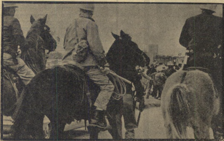
סגני-שריף בסלמה תוקפים מפגינים