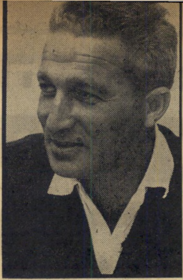
תועמלן זכין לניקולו, לא מארכס

עוד מעט יתחיל המירוץ. המתחרים מתבקשים להתייבב ליד קו הזינוק, אבל רק רץ אחד מופיע. היתר עסוקים ב'מקלחת, או מחפשים את תלבושתם. כזה היה השבוע מצב המפלגות הישראליות, העומדות על סף מערכת הבחירות. מכולן היתה רק אחת מוכנה למירוץ: מפ"ם. היא כבר הכינה את סיסמאותיה, ומטה הבחירות שלה הוא היחיד בין ה'מטות המפלגתיים הפועל על כל שלוחותיה. כי מפלגה זו נמצאת במצב המאושר, בו אין היא מפלגת עליידי סיכסוכים פנימיים ואין מנהיגיה שקועים בנסיגות מייגעים של חיבור או פילוג. מיבחן הכוח הראשון, בבחירות להסתדרות פועליה בניין, בו עלה כוחה של מפ"ם בכמה אחוזים, השחיו את תאבונה.