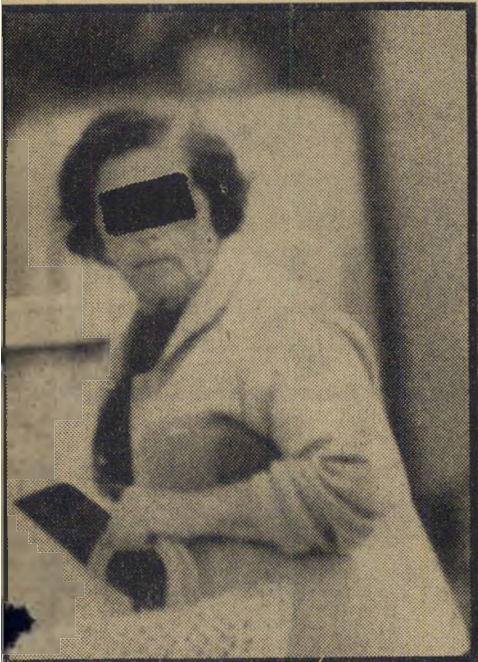
אם הגימנוסטית "סובבו לה את הראש"

הפרופסור קורט סיפה: היה אחד מן האסירים המעטים שזכה בכלא ליחס מיוחד. הוא קיבל חדר עבודה ב-