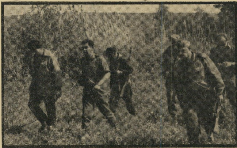
האלוף בשטח אלוף פיקוד הצפון, אלוף דוד אלעזר (שני משמאל) נראה צועד, חמוש בעוז, בחברת מלוויו, בקירבת גבול האזור המפורז, שם פרצה התקרית. האלוף הגיע למקום אחרי יריות הסורים, צפה בתגובת חייליו.

אומנם אין זה איום מפורש, אולם מפעולות ישראל ומתגובת הסורים משתמעת גישה ברורה: ישראל אינה משלימה עם ההטיה הסורית, והיא יכולה להגיב במקום הרצוי לה.