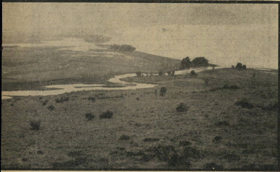
שפך הירדן זהו המקום בו נשפך הירדן לכינרת. הגבול הבינלאומי עובר כמה עשרות מטרים ממזרח לירדן ואילו קו האזור המפורז כקילומטר ממערב לו. במקום בו נראית קבוצת עצים ליד השפך מצוי המוצב הסורי הקרוי מוצב השפך.

* על שם גופיה ששימשה כנקודת ציון למדידה שבוצעה עתה על ידי משקיפי או"ם.