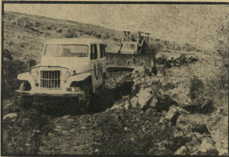
זהו הדחפור שבגללו אירעו השבוע חילופי יריות תותחים. לפני הדחפור נראית מכונית משקיפי הא"ם שבאו לשטח, אחרי שקיבלו לכך היתר משלטונות ישראל, כדי לבצע בו מדידות ולקבוע כי הוא אמנם שטח ישראלי ריבוני שאינו נמצא בתחום האזור המפורז.

כשלושה קילומטר צפונית למקום בו נשפך הירדן לכינרת, זורם הירדן בתוך האזור המפורז. צפונית משם, לאורך קילומטר וחצי, הוא זורם בתוך שטח ישראל, כשגבול האזור המפורז הוא במרחק כמה עשרות מטרים מזרחית לירדן. אולם מצב זה קיים רק להלכה על גבי המפה. למעשה שלטו הסורים עד לזמן האחרון על רצועות קרקע מתוך לשטח המפורז — עד לירדן, כי נקודה אחת, בחלקה הנקראת בשם חלקת