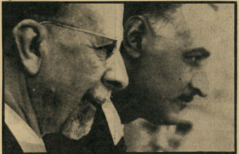
נשיאים עבד אל נאצר ואולברייכט בקאהיר בון נשמה עמוק, ובלעה

מארק, ומומחיה בנו מיצפה כוכבים, רש" תות חשמל ומפעלי תעשייה. בד בבד עם הקשרים המסחריים, נוצרו קשרים מדיניים. תחילה הוחלפו מישלחות מסחריות, אחריהן מוגו נציגויות מיסדת ריות קבועות, ולאחר מכן הוקמו קונסול ליות. שלב אחרון לפני ההכרה הרשמית: מינוי "נציג דיפלומטי", עוד כאן לא ראתה בון את צעדי מצרים כהפרת תורת האלשטיין, הקובעת כי יש לנתק את היחסים עם כל מדינה המכירה בגרמניה המזרחית.