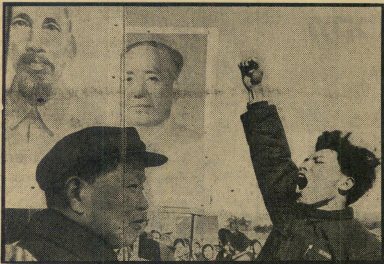
הפגנה אנטי-אמריקאית בהאנוי*

שארל דה-גול פירסם, בשותפות עם ה-סובייטים, הצעה לכנס ועידת-שלום לענייני