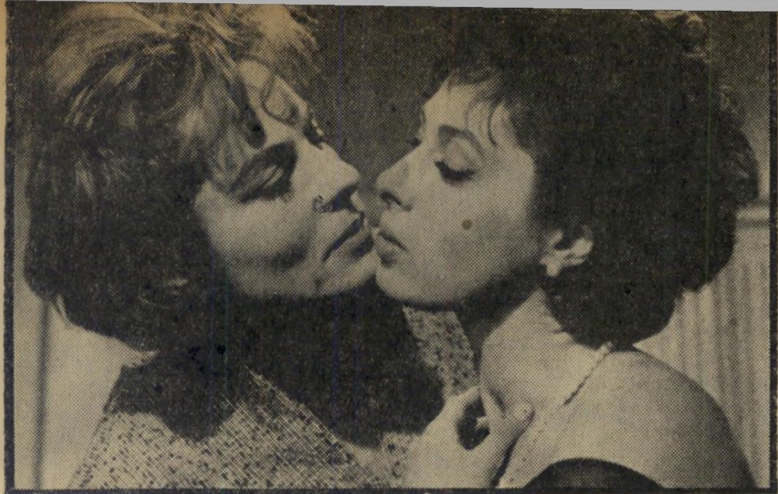
גאם ולינדפורס כ"דלתיים סגורות" תיאטרלי, מכני ואיטי

החזה הגברי של עצמו ויאמר, גאה, לסור בכים אותו בקהל: "אני האיש".