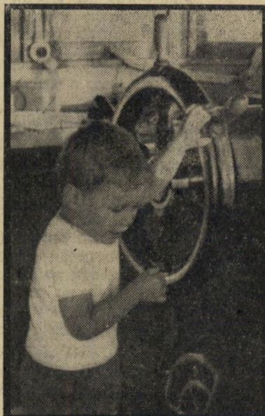
ניצור עירני (יפני האסון) טרמפ ימי