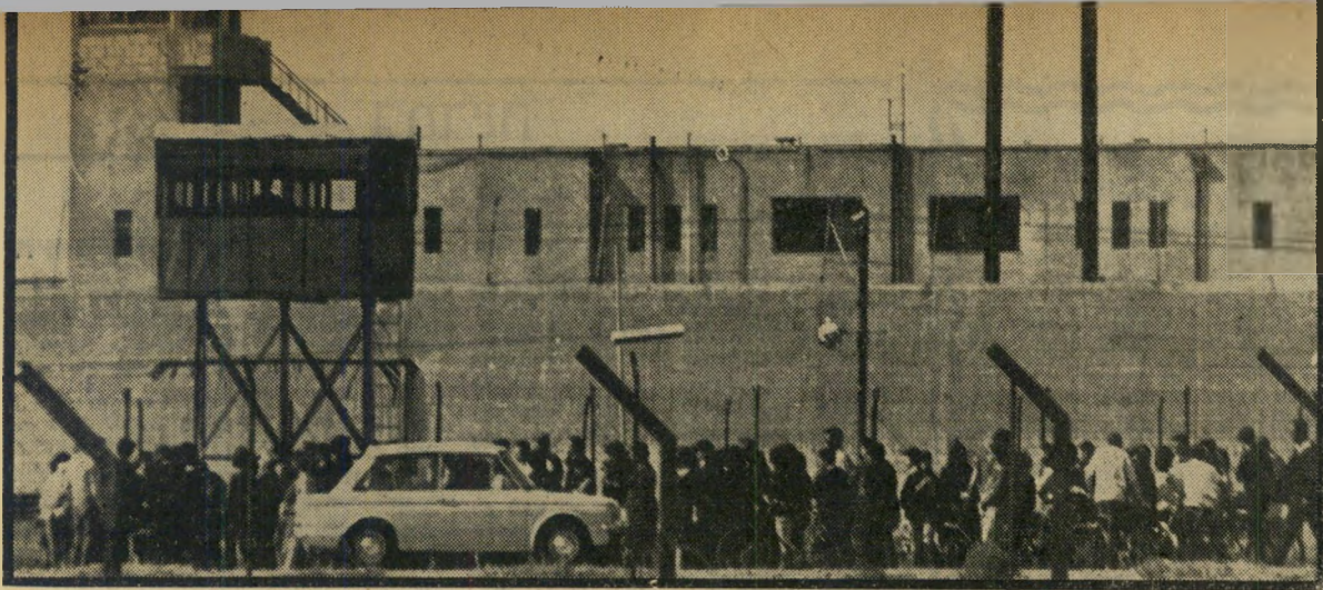
נוער מכל הארץ מפגין לפני בית-הסוהר ברמזה הפגנה עליזה

"We shall overcome." והם באו. מאה צעירים וצעירות שהתאספו לקריאת ועד הנוער לאחווה יהודית-ערבית הגיעו לשער המחנה כששירה בפהם. אף אחד מהם לא חשב לעבור על החוק, להתנגש בשומרים או להתגרות בהם. כי סיסמת היום הייתה: "אנו לא מפירים את החוק!"